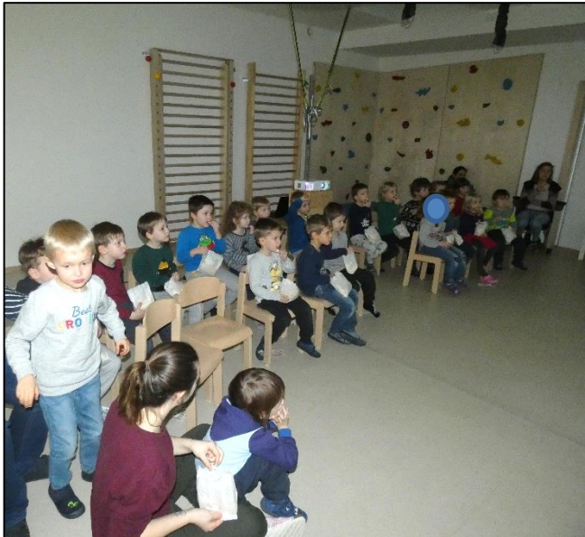
Platz nehmen auf den Kinostühlen

Nach einer ausgiebigen Vorbereitungsphase mit Gesprächen über Eisbären, dem Basteln von Tickets und dem Herstellen von selbstgemachtem Popcorn, verwandelten wir unsere Turnhalle in ein echtes Kino. Der Film „Lars der kleine Eisbär“ fesselte uns alle!