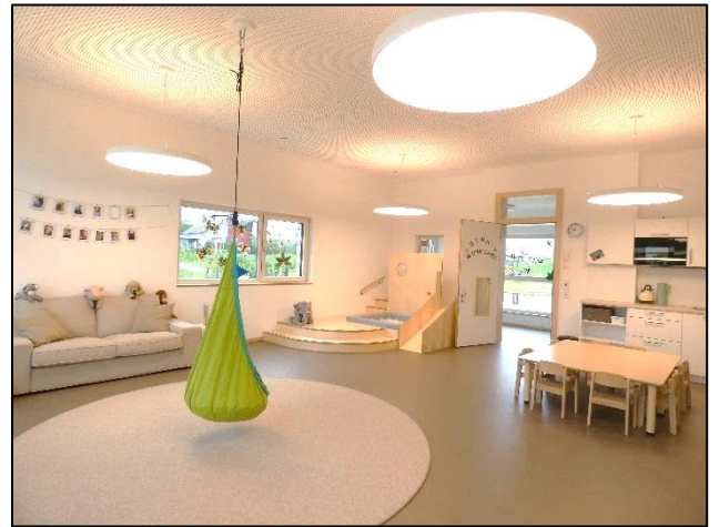
Glühwürmchen – Gruppenraum