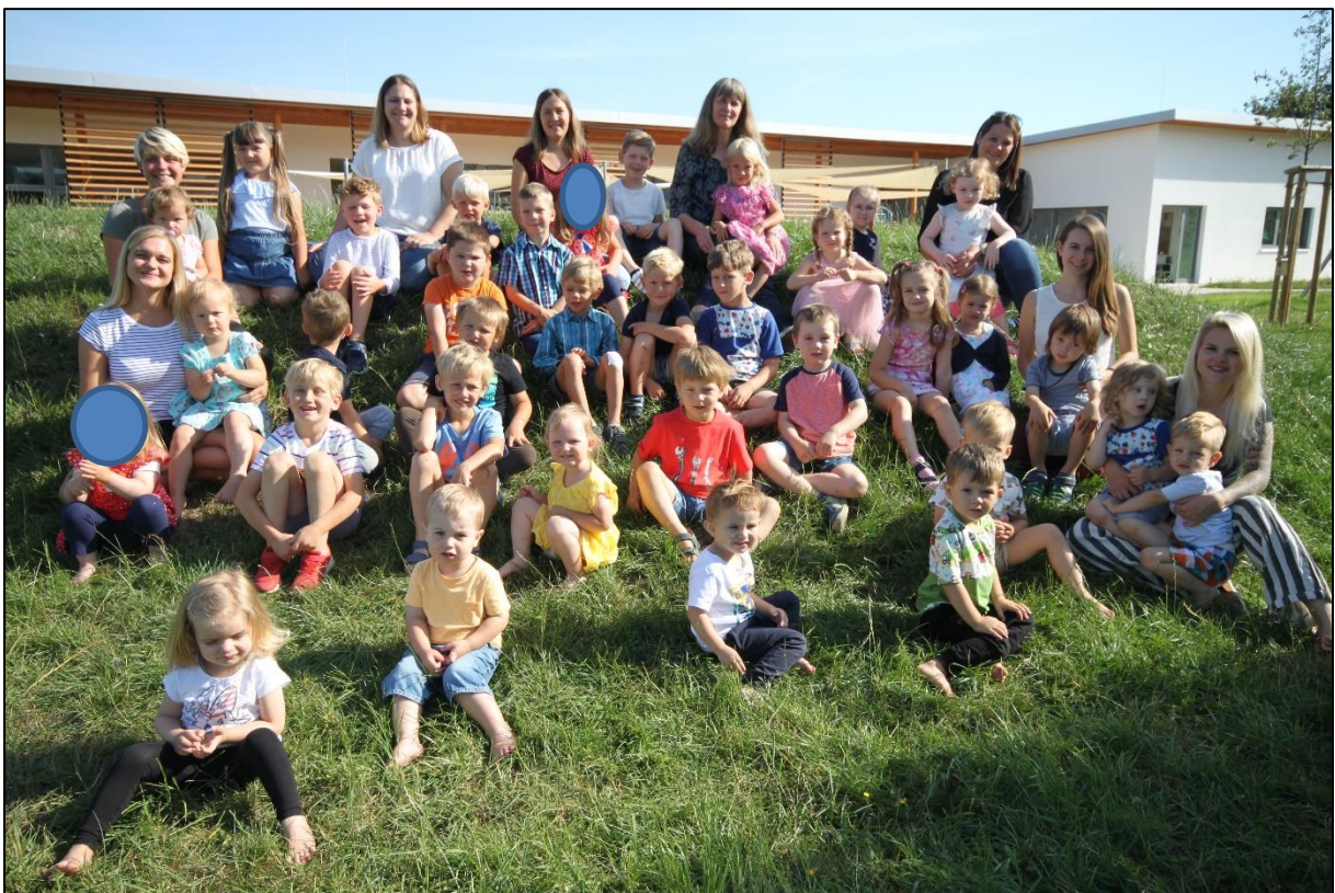
Unsere ganze Kita