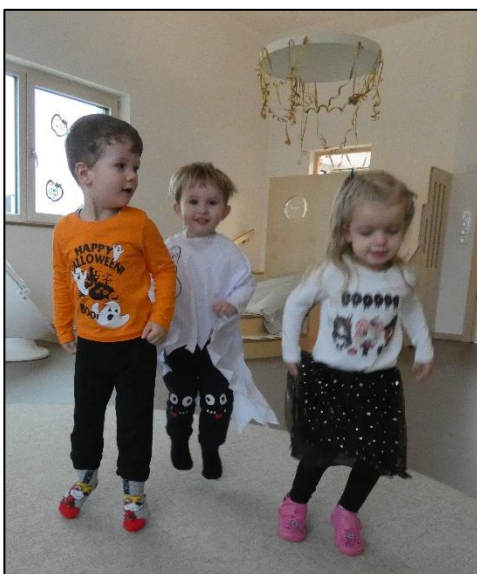
Halloween bei den Glühwürmchen