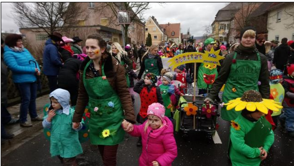
Auf geht's Blümchen!