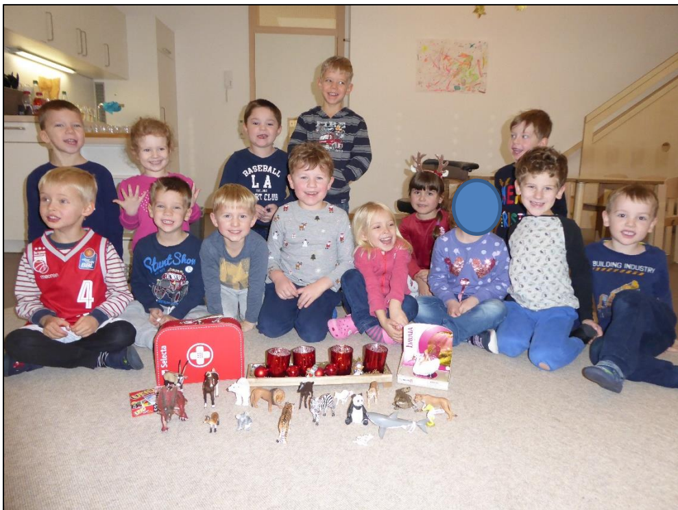
Nach der Bescherung bei den Käfern