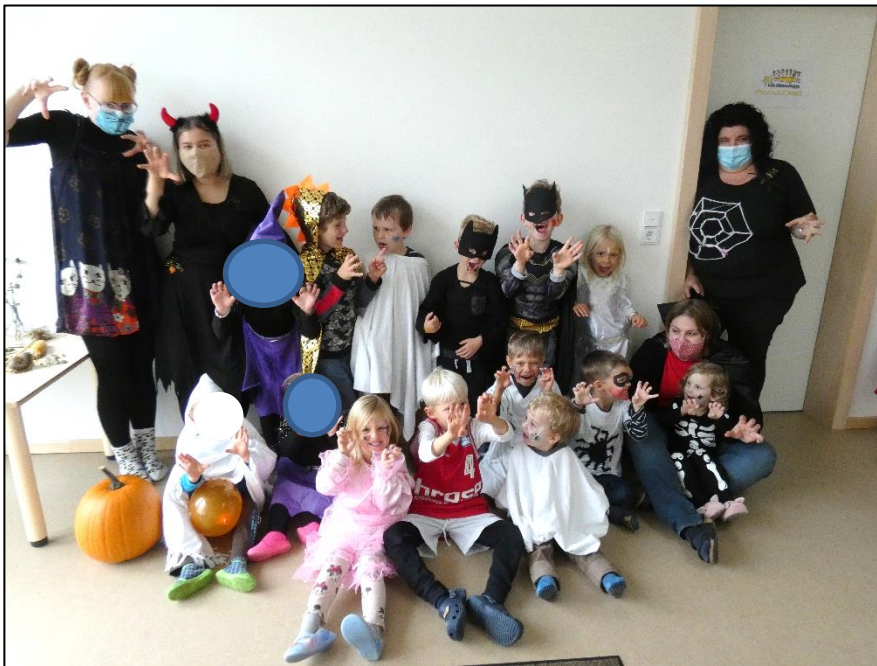
Halloween bei den Käfern

Auch unsere Halloween Party war gruppenübergreifend geplant, doch mal wieder zog uns die Pandemie einen Strich durch die Rechnung. Deshalb feierten wir gruppenintern mit Kinderschminken und gruseligen Spielen.