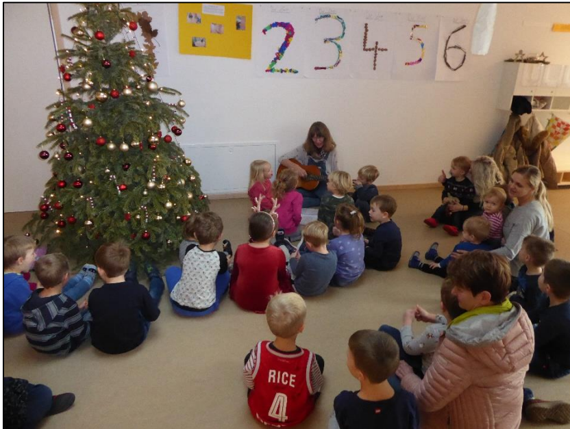
Singen unterm Weihnachtsbaum

Beim gemeinsamen Singen von Weihnachtsliedern unter dem Christbaum müssen uns wohl die Engel gehört haben. Als wir wieder in unsere Gruppenräume zurückgegangen sind, waren für die Kinder viele Geschenke da. Jedes Kind durfte ein Geschenk auspacken. Darin waren Spielsachen für die Gruppe.