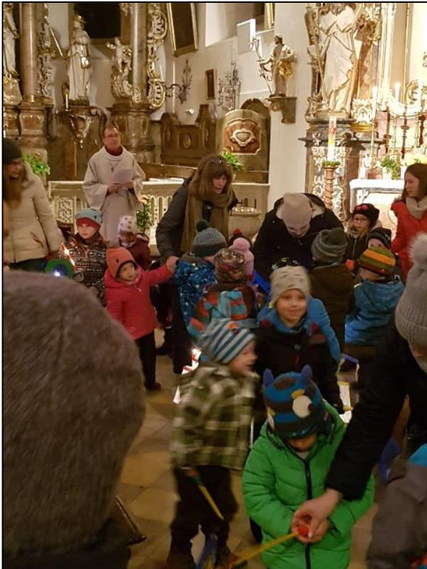
Auszug aus der Kirche

Nach einem wunderschönen Wortgottesdienst, geleitet von unserem Gemeindeferenten Herrn Zenk, machten wir zusammen mit der Kindertagesstätte Sonnenblume, den Eltern und unseren Laternen auf den Weg. Wir zogen singend durch die Straßen und sogar die entscheidende Szene von St. Martin wurde nachgespielt. Im Dorfgarten feierten wir zusammen gebührend mit Bratwürsten, Leberkäse, Brezen, Glühwein und Kinderpunsch. Ein gelungenes gemeinsames Fest an dem viele Buttenheimer dabei waren.